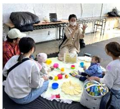
赤ちゃんコミュニケーションをとる