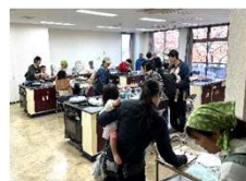
おむすび会。好きな具材を選んで、子どもたちも自分で作ります

また、この日に同時開催された「おむすび会」も大盛況でした。これは、土鍋で炊いたご飯をみんなでおにぎりにして食べる会で、亀吉や市民センターで開催されているものです。親子の「おいしい!」の声がたくさん聞かれ、参加者同士の交流のようすもみられました。