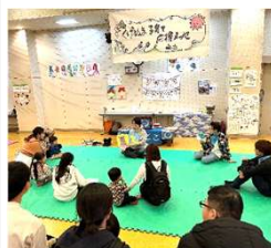
英語の絵本に夢中の子もたち