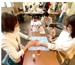
ハンドセラピーで癒されます