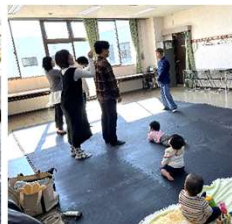
太極拳でこわばった身体をラクに

また、この日に同時開催された「おむすび会」も大盛況でした。これは、土鍋で炊いたご飯をみんなでおにぎりにして食べる会で、亀吉や市民センターで開催されているものです。親子の「おいしい!」の声がたくさん聞かれ、参加者同士の交流のようすもみられました。