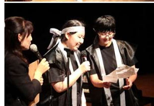
出演後のインタビューも和やかに