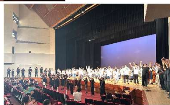
最後は出演者、会場一体となって合唱しました