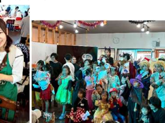
コンテスト1位おめでとうございます！