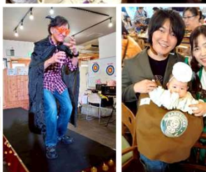
ステージでポーズを決める

10/13(祝)、秋まつりが開催されました。ハロウィンをテーマとして、仮装コンテストを中心にさまざまなブースを楽しむものでした。今回は、ウイナーを使った「ぐるぐるミラくづくり」やお面ペイン、バルーンアート、パンづくり体験などのブースがあり、皆様イベント時間いっぱい楽しまれました。仮装コンテストも多くの方々に参加いただきました。それぞれ思い思いの仮装で可愛い姿やカッコいい姿がみられ、会場は湧き上がっていました。大人も子どもも、ちょっと早いハロウィンを満喫できたのではないのでしょうか。皆様ご来場、ありがとうございました。