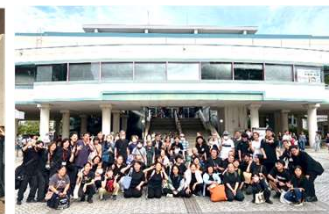
市民会館ホール前で記念撮影

9月23日(火)、藤沢市民会館で開催された「くげぬまグリーンコンサート 2025」に、私たちくげぬまつながり隊が亀吉と一緒に出演しました。くげぬまグリーンコンサートとは、鶴沼ではじまった、認知症や障害のある方が所属する音楽グループ・音楽家によるコンサートです。市民会館は来年改築となるため、大ホールで演奏するのは今回が最後です。